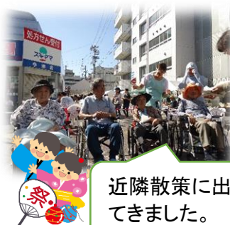
近隣散策に出かけられました。