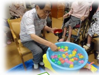
レクリエーションのコーナーですが、皆様、かなり集中されておりました。