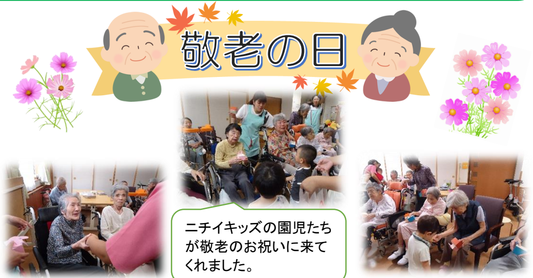
ニチイキッズの園児たちが敬老のお祝いに来てくれました。