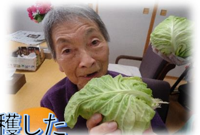
ミニ農園から収穫した キャベツで お好み焼きパーティー