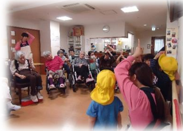
ニチイキッズの 園児たちとの交流